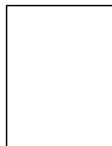
Cap Ibu Jari Kanan